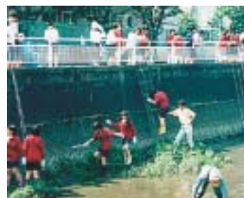
▲岩戸川を清掃する子どもたち

梅林中学校の2年生では「岩戸川蘇生プロジェクト」と銘打って、総合的な学習の時間に校区を流れる岩戸川をめぐる学習を位置づけています。この学習も未来教育プロジェクト学習の手法を取り入れ、テーマとゴールを明確にして取り組んでいきます。